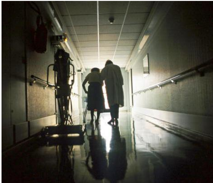
Heimbewohnerin, Pflegerin: Bedürftige mit mächtigen Erinnerungen

glocken läuten, und der Westdeutsche Rundfunk wird Nachrichten senden. Ich höre gern Nachrichten und lasse mich ungern dabei stören. „Lasset uns beten für alle, die sich der Last ihres Lebens nicht gewachsen fühlen, ewiger Gott, wir bitten dich.“ Auf dem Autorücksitz klappern in den Kartons Bilderrahmen und Geschirr, dreimal Gedeck, dreimal Besteck, zwei Gläser für Bier, vier für Wein, vier für Wasser. Ein scharfes Messer. Der Lieferwagen des polnischen Kleinunternehmers, der beim Umzug hilft, ist bereits am Ziel. Er hat zwei Sessel transportiert, das Bett, einen Stuhl, einen Tisch, die Regale, die Bücher. Es ist Karfreitag, die