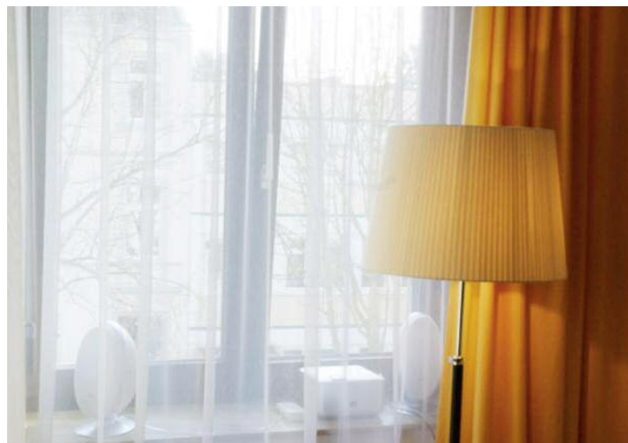
Thimms Zimmer im Seniorenheim: „Klingeln Sie um Hilfe?“

Verreisten wir, lud er am Abend zuvor die leeren Kof-