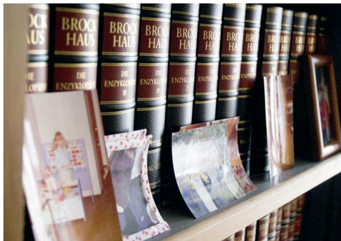
Familienfotos: In vielen Heimen geht es weniger freundlich zu

Die meisten alten Frauen und Männer harren bis zum letzten Moment in ihrem vertrauten Zuhause aus. Es geht in vielen Heimen weniger freundlich zu als in der Bleibe meines Vaters. In manchen Einrichtungen werden die Alten mit Medikamenten ruhiggestellt, damit sie nicht verwirrt umherlaufen. Es wird das Bettzeug nicht regelmäßig gewechselt, es reagiert niemand auf den Notruf. Und immer wieder überfordern die Erinnerungen der alten Menschen die Pfleger und Schwestern, die aus Polen und aus Weißrussland stammen, aus Ecuador, der Ukraine oder der