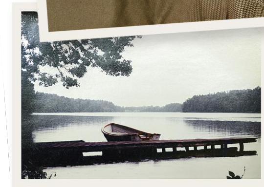
Schüler Thimm 1937, Erinnerungsfoto aus Masuren Die Seen einer unbeschwerten Kindheit

Die meisten erwachsenen Kinder aber sagen, dass sie die Eltern am liebsten in einer häuslichen Umgebung betreut wissen wollen. Es ist auch volkswirtschaftlich die günstigste Lösung – jedenfalls so lange die Pflegenden durchhalten. Mehr als der Hälfte schmerzt der Rücken. Ein Vier-