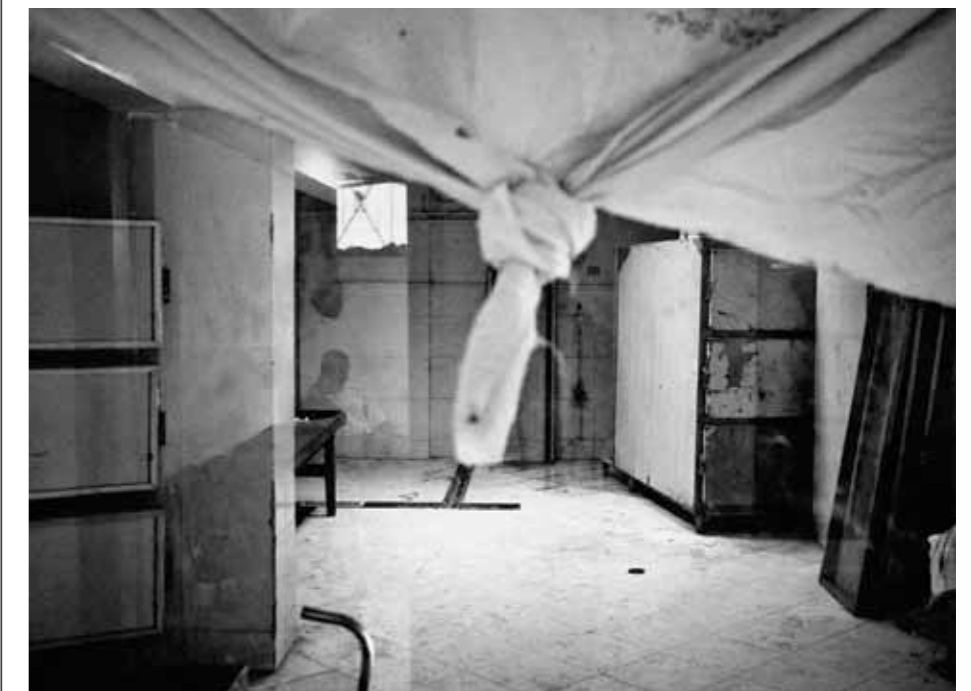
Al-Arish, Ägypten: Die Leichenhalle des örtlichen Krankenhauses, wo viele tote Afrikaner liegen und für die Beerdigung vorbereitet werden.

nicht. Überlebende der Foltercamps berichten zwar von einem Mann mit weißem Kittel und Arztkoffer, den die Kidnapper ihren Geiseln vorführen, um ihnen dann zu drohen: »Wenn eure Familie nicht zahlt, schneidet der Doktor eure Nieren raus.« Aber selbst gesehen hat einen Organraub niemand. Vielleicht ist die Drohung eine perfide Psycho-Folter, um