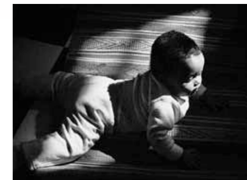
Ein krabbelndes Baby im Frauenzentrum von Tel Aviv.

wird der Zutritt verwehrt. Mit der Begründung, die ehemaligen Geiseln der Beduinen seien Wirtschaftsflüchtlinge, damit illegal im Land und ohne Anspruch auf politisches Asyl.