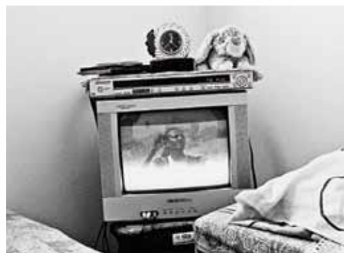
Auf dem Fernseher in Sebles Zimmer stapeln sich ihre Habseligkeiten , auf dem Bildschirm laufen Musikvideos aus dem eritreischen Fernsehen.

Stahlzauns fertiggestellt, der sich entlang der Grenze zu Ägypten von Eilat an der Nordspitze des Roten Meeres bis nach Gaza zieht und afrikanische Flüchtlinge aus dem Sinai fernhalten soll.