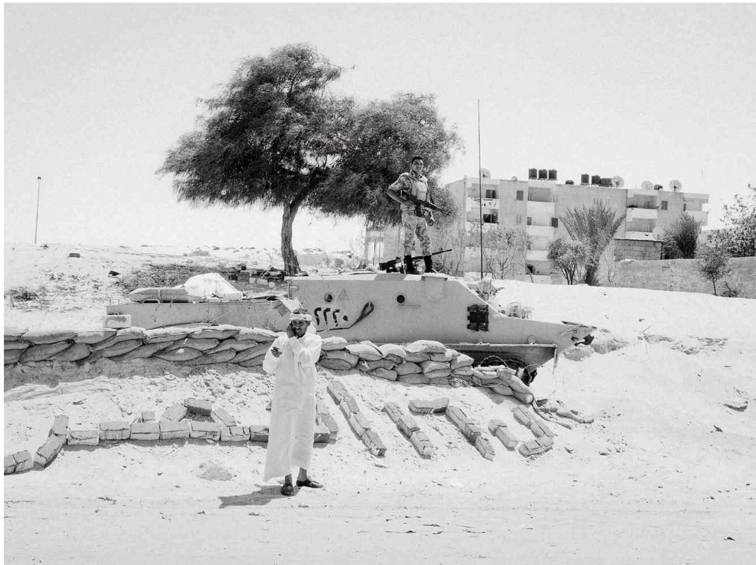
Al-Arissa-Checkpoint, Nordsinai, Ägypten: Ein Beduine telefoniert vor einem Posten der ägyptischen Armee im Randgebiet von Al-Arish.