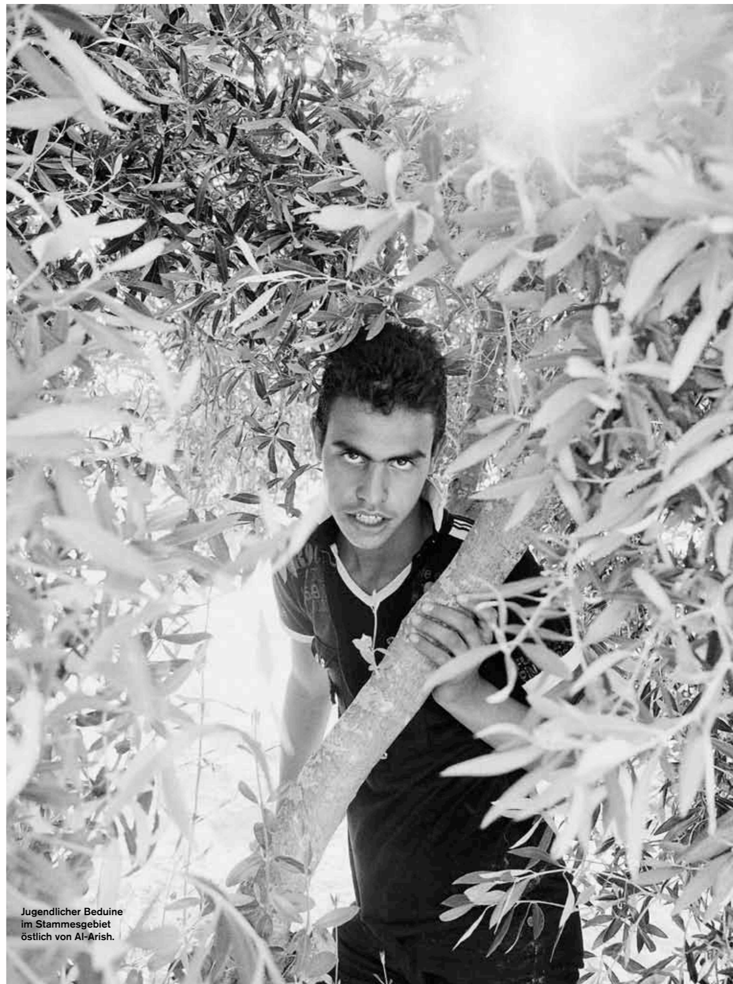
Jugendlicher Beduine im Stammesgebiet östlich von Al-Arish.

MICHAEL OBERT und der Fotograf MOISES SAMAN sind als erfahrene Krisen- und Kriegsberichterstatter einiges gewohnt. Doch die grausamen Geschichten der Folteropfer, die sie in Tel Aviv und Kairo trafen, verfolgen sie noch immer. Seit ihrer Rückkehr aus dem Nahen Osten haben die beiden Journalisten in Europa zahlreiche Kliniken und Hilfsorganisationen kontaktiert, um Selomon, dem jungen Eritreer, der durch ihre Geschichte führt, zu einer Handtransplantation oder zu Prothesen zu verhelfen – bisher erfolglos.