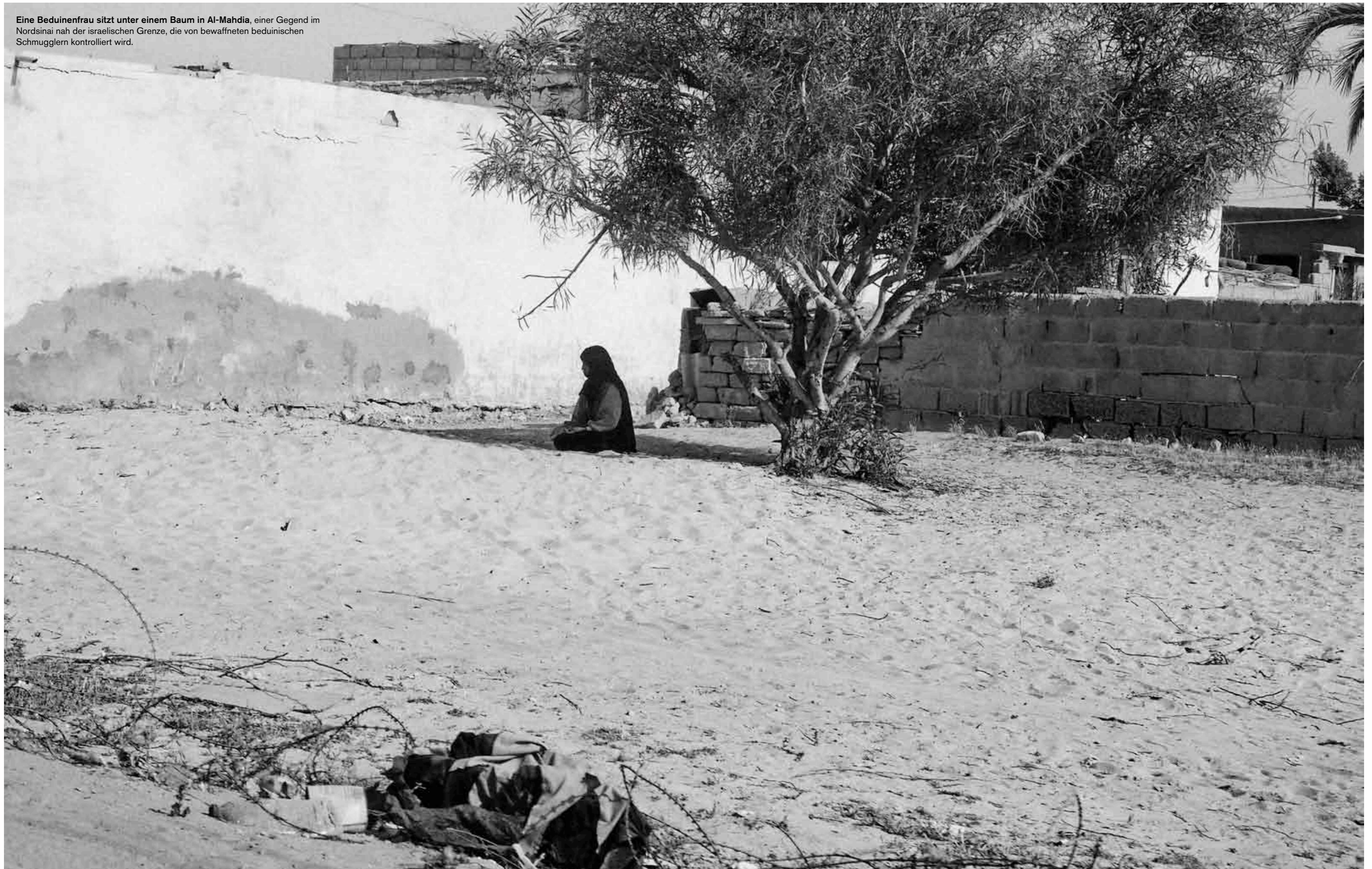
Eine Beduinenfrau sitzt unter einem Baum in Al-Mahdia, einer Gegend im Nordsinai nah der israelischen Grenze, die von bewaffneten beduinischen Schmugglern kontrolliert wird.